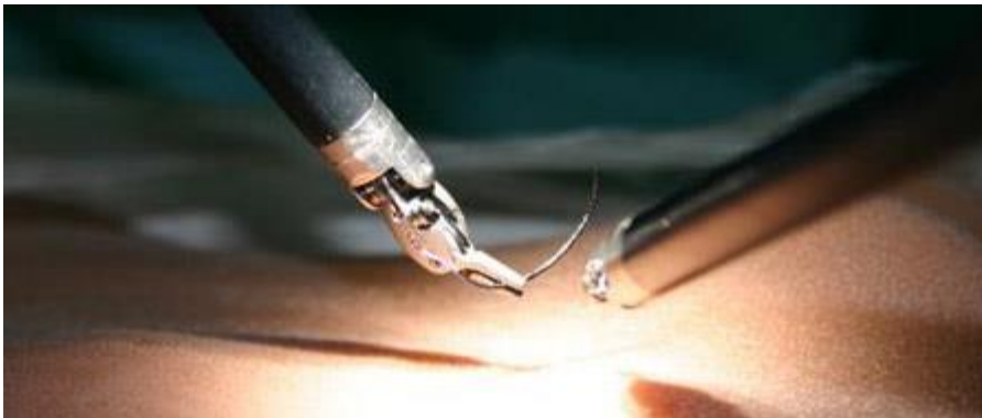
Da Vinci® Operationen | Roboter-assistierte minimal-invasive Operationen